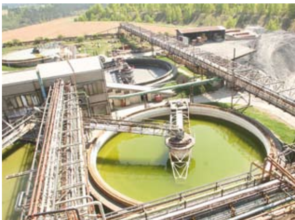
Foto: uranové doly Rozna